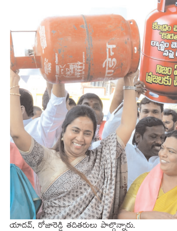
యాదవ్, రోజారెడ్డి తదితరులు పాల్గొన్నారు.