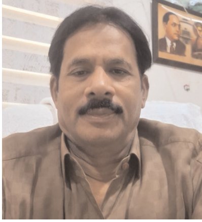
అమలులో ఉన్న పథకాలతో పాటు రాబోయే