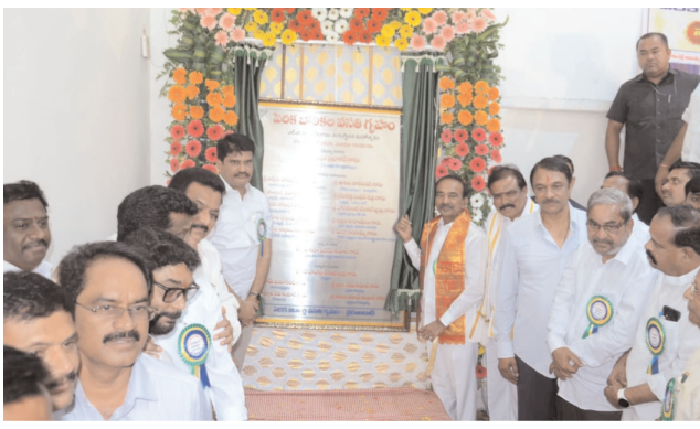
కార్యక్రమాన్ని ఘనంగా నిర్వహించారు.