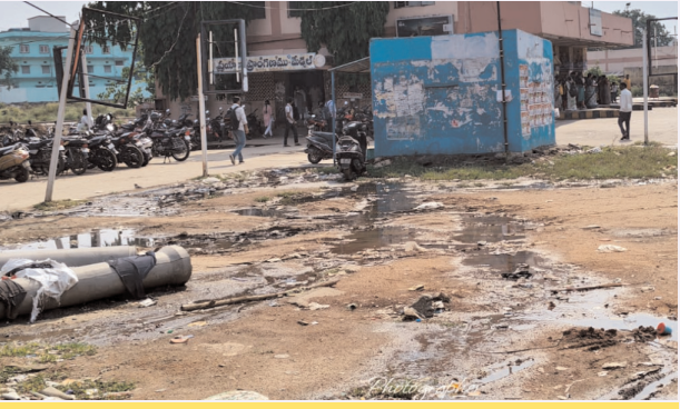
మేడ్చల్ ఆర్టీసీ డిపో ప్రాంగణంలో ఏరులై పారుతున్న మురుగునీరు

మేడ్చల్, ఏప్రిల్ 20 (నగర నిజం): ఒకవైపు మౌలిక సదుపాయాల కల్పనపై ప్రభుత్వం కోట్లాది రూపాయలు వెచ్చిస్తున్నామని చెబుతున్నా. క్షేత్రస్థాయిలో పరిస్థితి మాత్రం అందుకు పూర్తి భిన్నంగా తయారైంది. జీహెచ్ఎంసీ మేడ్చల్ సర్కిల్ పరిధిలోని మేడ్చల్ ఆర్టీసీ బస్ డిపో ఆవరణ ప్రస్తుతం మురుగు కాల్వను తలపిస్తోంది. అస్తవ్యస్తంగా మారిన డ్రైనేజీ వ్యవస్థతో ప్రయాణికులు తీవ్ర ఇబ్బందులు ఎదుర్కొంటున్నారు.