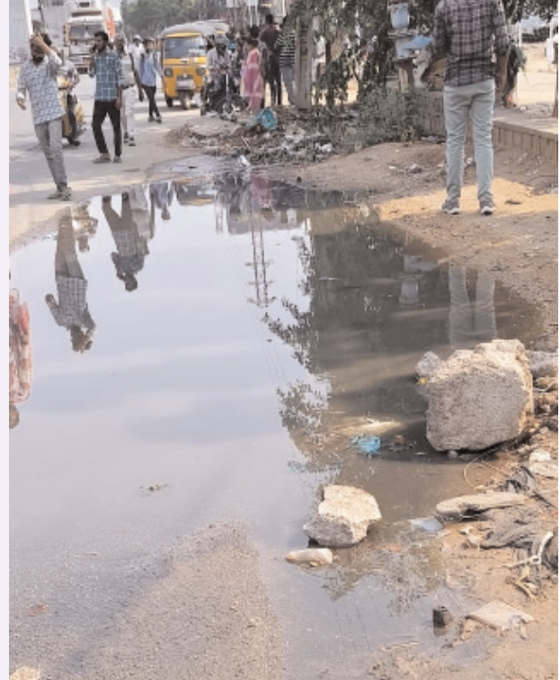
44వ జాతీయ రహదారిపై ఏరులై పారుతున్న మురుగునీరు

అధ్యాపకులు మారడం అధికారుల నిర్లక్ష్యానికి అడ్డం పడుతోందని విమర్శించారు. ఇప్పటికైనా సంబంధిత అధికారులు మొద్దునిద్ర వీడి, పగిలిన డ్రైనేజీ పైపులకు తక్షణమే మరమ్మతులు చేపట్టాలని, రోడ్డుపై నిలిచిన మురుగునీటిని తొలగించి డిపో ఆవరణను శుభ్రపరచాలని ఆయన కోరారు.