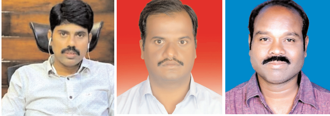
రాజేంద్రనగర్, ఏప్రిల్ 20 (నగరనిజం ప్రతినీధి) : జిల్లా అధికారిలకు ప్రభుత్వం మంజూరు చేసిన అక్రెడిటేషన్ కార్డుల జారీ కోసం ప్రభుత్వం కమిటీని