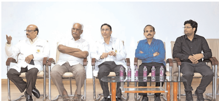
● ఘనపూర్ మెడిసిటీలో ఘనంగా ముగిసిన 'హెడ్ అండ్ నెక్ క్యాన్సర్' అవగాహన

వారోత్సవాలు మేడల్, ఏప్రిల్ 21 (నగర నిజం): పొగాకు, గుట్కా, మాదక ద్రవ్యాల వినయోగంతోనే క్యాన్సర్ ప్రమాదం పొంది ఉందని, వ్యాధిని ప్రారంభ దశలోనే గుర్తిస్తే సరైన వైద్య చికిత్సతో పూర్తిగా నివారించవచ్చని వైద్య నిపుణులు స్పష్టం చేశారు. ఘనపూర్ లోని మెడిసిటీ ఇన్స్టిట్యూట్ ఆఫ్ మెడికల్ సైన్సెస్ ఈవెన్ట్ (ఊపీ) విభాగం ఆధ్వర్యంలో వారం రోజుల పాటు నిర్వహించిన 'హెడ్ అండ్ నెక్ క్యాన్సర్' ప్రత్యేక అవగాహన వారోత్సవాలు కళాశాల ఆడిటోరియంలో ఘనంగా ముగిసాయి.