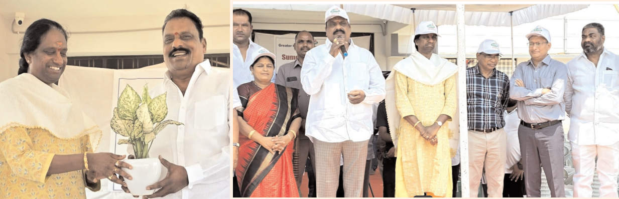
రాజేంద్రనగర్, ఏప్రిల్ 27(నగరనిజం ప్రతినిధి) : యువకులు విద్యతోపాటు క్రీడల్లో ఆసక్తి