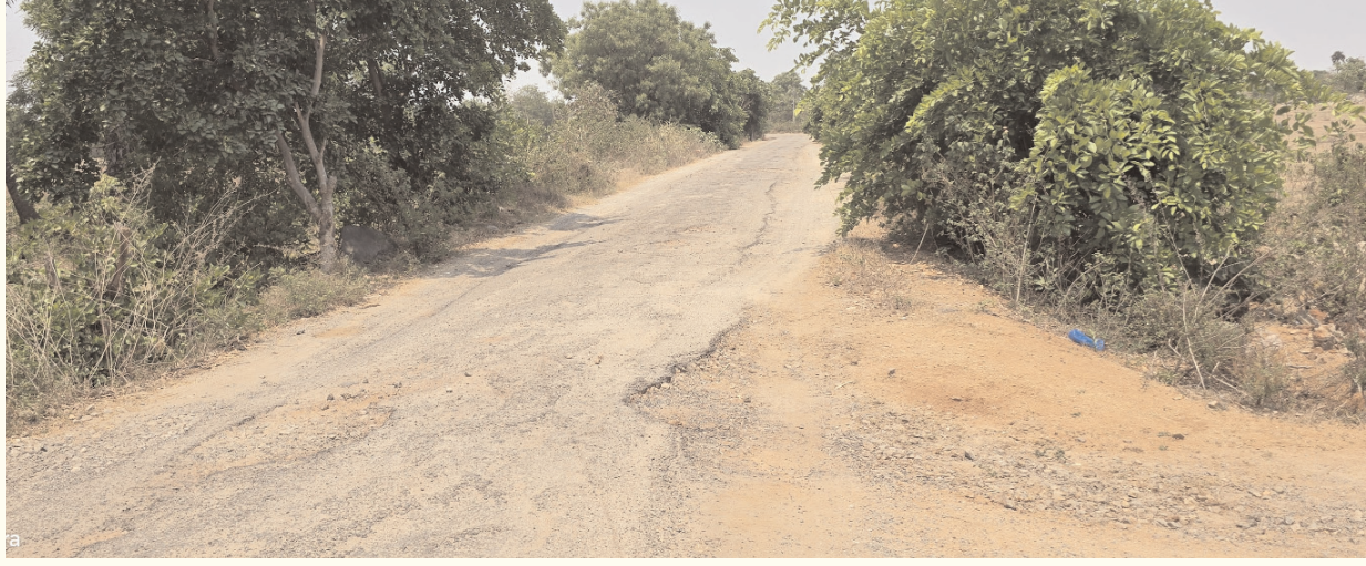
“ఇంతకాలం ఈ గుంతల రోడ్డు బాధలు భరించాలి?”