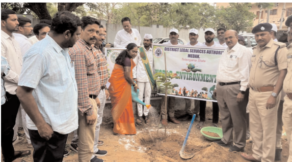
ఆదేశించారు. ముఖ్యంగా జూలై 31వ తేదీలోపు అన్ని మరమ్మతులు, అభివృద్ధి పనులు పూర్తి చేసి భవనాన్ని నిర్దం చేయాలని కాంట్రాక్టర్ కు స్పష్టమైన ఆదేశాలు జారీ చేశారు.

ప్రపంచ పర్యావరణ దినోత్సవం సందర్భంగా మొక్కలు నాటిిన జిల్లా న్యాయమూర్తి