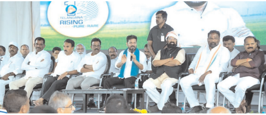
మహబూబ్ నగర్, 5 జూన్ (నగర నిజం) : ఉమ్మడి మహబూబ్ నగర్ జిల్లాలో చేపట్టిన సాగు, తాగునీటి ప్రాజెక్టులను సన్స్కృత్యమలం చేయాలనే లక్ష్యంతో ప్రభుత్వం చిత్తశుద్ధి