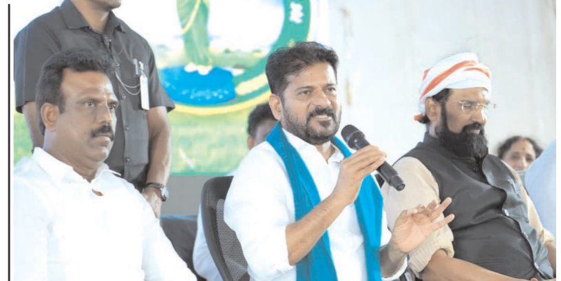
తెలిపారు. కేంద్ర ప్రభుత్వం మద్దతు ధర ప్రకటించి వడ్డు కొనుగోలు చేయకపోవడం సరికాదన్నారు. రాష్ట్ర అవసరాలకు అనుగుణంగా యూరియా కేటాయించాలని కేంద్రాన్ని కోరారు. నీటి హక్కులు అంశంపై మాట్లాడుతూ గోదావరి జిల్లాలో తెలంగాణకు 968 టీఎంసీల నికర జలాల కేటాయింపులు ఉన్నాయని, ఒక్క చుక్క నీటి విషయంలో కూడా రాజీ పడబోమని స్పష్టం చేశారు. కృష్ణా జలాలపై ఉన్న సమస్యలను ఈ ఏడాది డిసెంబర్ నాటికి పరిష్కరించేందుకు చివరి వరకు పోరాడతామని తెలిపారు. మహారాష్ట్రతో సంప్రదింపులు జరిపి తుమ్మిడిపాల్లో వద్ద ప్రాణహిత-చేపేజ్ ప్రాజెక్టు అమలుకు చర్యలు తీసుకుంటున్నామని, ఈ విషయంపై మహారాష్ట్ర ముఖ్యమంత్రికి ఇప్పటికే లేఖ రాసినట్లు ముఖ్యమంత్రి వెల్లడించారు.